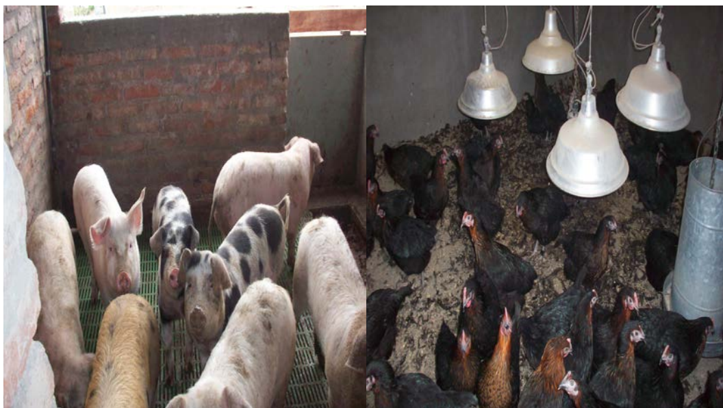
Figura 2 Distintas producciones animales en la escuela agropecuaria de Bajo Hondo