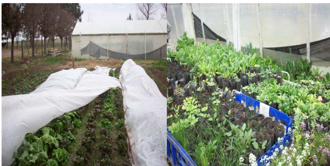
Figura 3 Distintas producciones vegetales en la escuela agropecuaria de Bajo Hondo